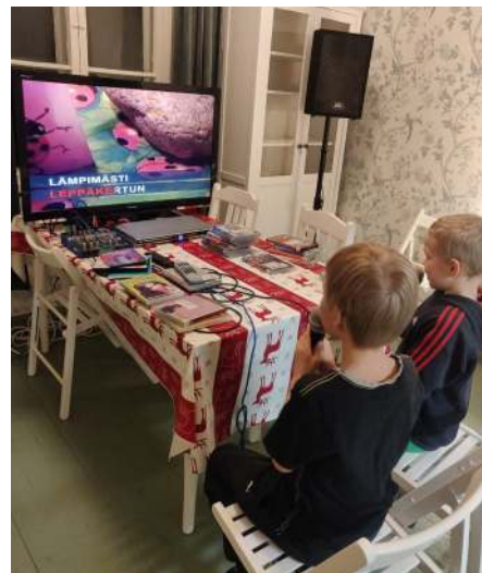
Pojat laulamassa karaokea.