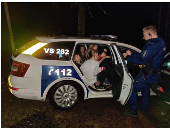
Kuinka monta lasta mahtuu poliisiauton takapenkille?