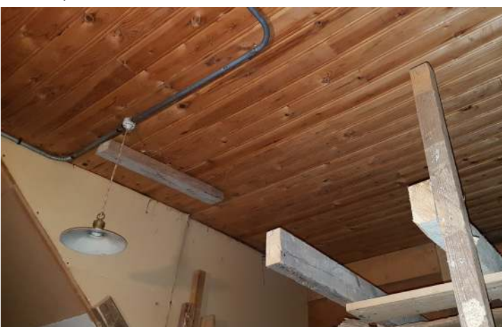
Yllä vanhaa paneelikattoa ja yksi löytyneistä vanhoista valaisimista. Oikealla Palkkatyöläinen-lehti vuodelta 1949.